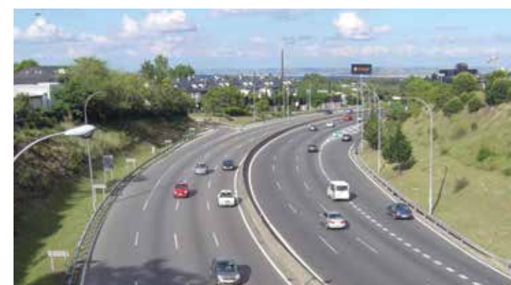
▲ Az. Autovía de Aragón. España.

Más de cien años comprometidos con el crecimiento y el progreso