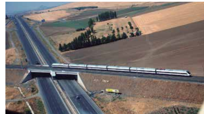
▲ Línea de Alta Velocidad Ankara-Estambul. Turquía.

a una gran cantidad de españoles trabajando en el extranjero”. “¿Qué país podría servir de modelo para España? “Deberíamos fijarnos en Estados Unidos”, señala Félix Revuelta . “Los japoneses lo tuvieron bien claro cuando empezaron a resurgir. Se basaron en la cultura americana y cuando tuvieron aquello dominado, inventaron. Cuando me dicen hay que inventar yo digo que ya está todo inventado. Estados Unidos va por delante de nosotros un montón de años. Debemos aprender de ellos en muchas cosas” recalca.